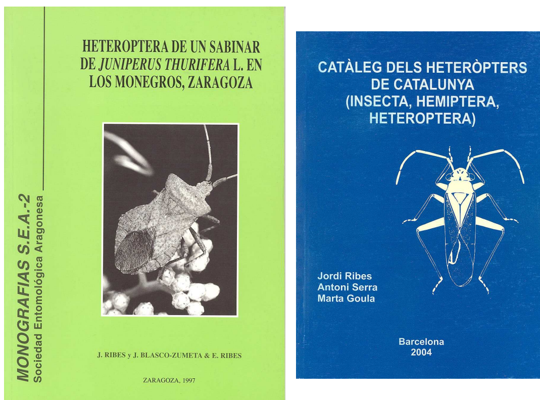
FIGURA 2. Dos destacadas monografías de Jordi Ribes: la dedicada a la particular fauna de Los Monegros, Aragón (70), y el catálogo de Cataluña (103), que es considerada una síntesis de gran relevancia a nivel ibérico.