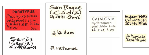
FIGURA 3. Algunos conjuntos de etiquetas de Jordi Ribes, como pequeña muestra de su incansable exploración y estudio de material de toda la Península Ibérica, entre otras áreas abarcadas (norte de África, Macaronesia, etc.).